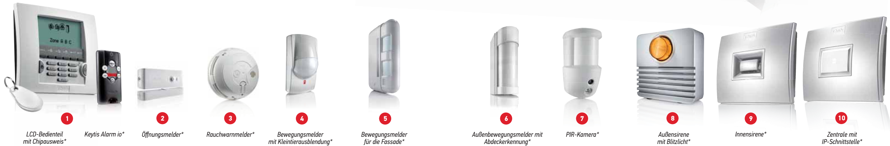
1 LCD-Bedienteil mit Chipausweis*

Mithilfe einer Internetverbindung haben Sie zahlreiche Kontroll- und Überwachungsmöglichkeiten, vom Inneren Ihres Hauses oder aus der Ferne. Wird Alarm ausgelöst, erhalten Sie über Mobilfunk eine SMS-Benachrichtigung.