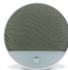
Sirène 104 décibels autonome avec aigus/graves alternatif