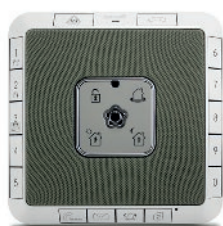
Centrale avec bouton SOS et push to talk, carte SIM et technologie Sigfox incluse