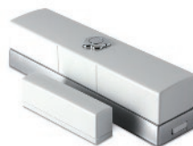
Détecteur de mouvement avec prise d'images et flash