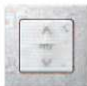
SMOOVE Commande à ajouter