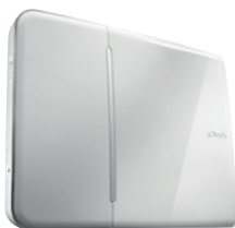
Centrale transmetteur GSM