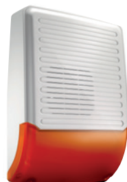
Sirène extérieure avec flash LED