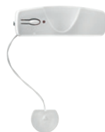
Détecteur de présence d'eau