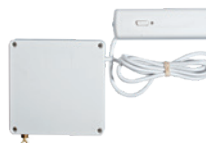
Détecteur de volet roulant