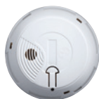
Détecteur de fumée