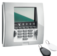
Clavier LCD avec lecteur de badge